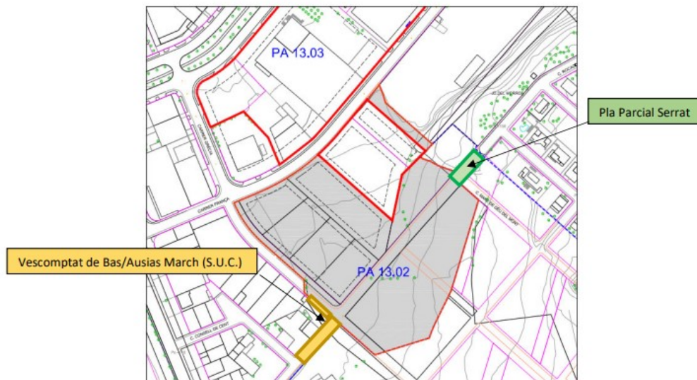
Àmbit del projecte d'urbanització: PA 13.02 + Vescomtat de Bas/Ausias March (S.U.C.)+ Rocacorba (PP Serrat)

Per analitzar aquesta qüestió el primer que cal tenir en compte és que tant el Subtram B, en la seva totalitat, com el Subtram C, queden fora de l'àmbit del PAU 13.02, com ho acrediten els plànols següents: